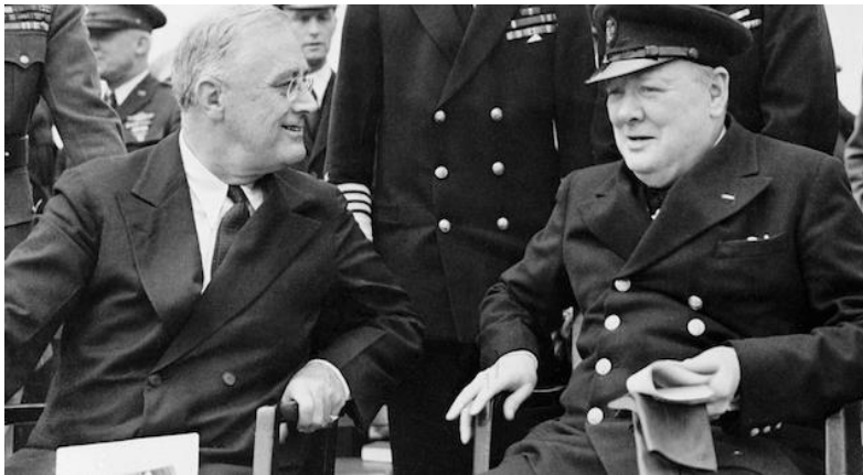
Roosevelt (z očali) in Churchill (s kapo)