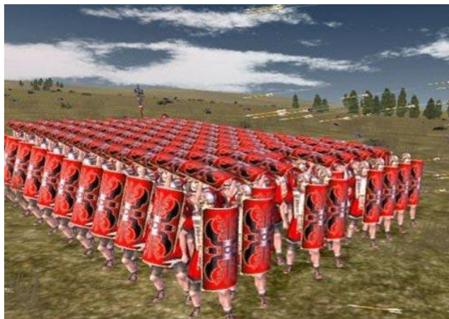
Slika 2: Želva – vojaška formacija, s katero so se vojaki zaščitili pred napadi. Stisnili so se skupaj in pokrili s štiti.