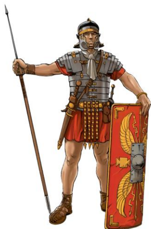
Slika 1: Legionar