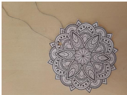
3. NAPELJI VRVICO